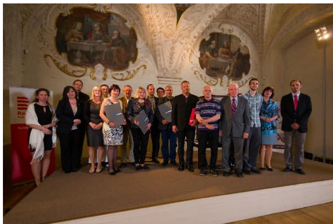
foto ze slavnostního vyhlášení